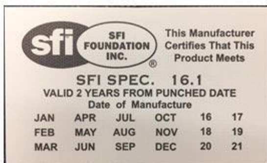
SFI Labels Prior to 2017