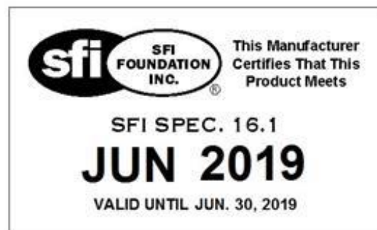
SFI Labels Available Jan. 1, 2017